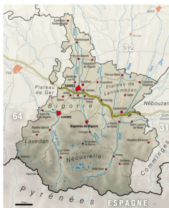
Carte des Hautes-Pyrénées

Situé à mi-chemin entre Tarbes et Lourdes, l'aéroport Tarbes-Lourdes-Pyrénées assure une liaison quotidienne avec Paris et des vols internationaux hebdomadaires. Ces vols fréquents résultent de la pratique du pèlerinage à Lourdes et de l'attrait des Pyrénées.